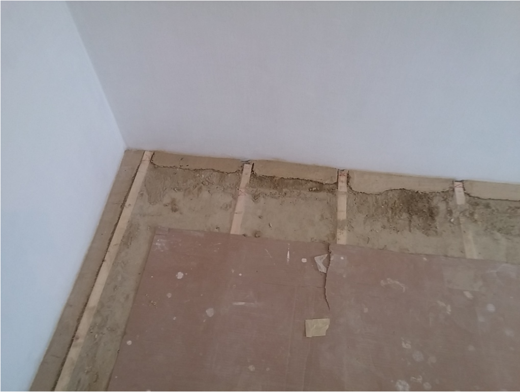
Fixierung mit Kalkmörtel