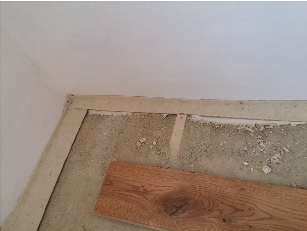
Abdeckung mit Schurwollvlies